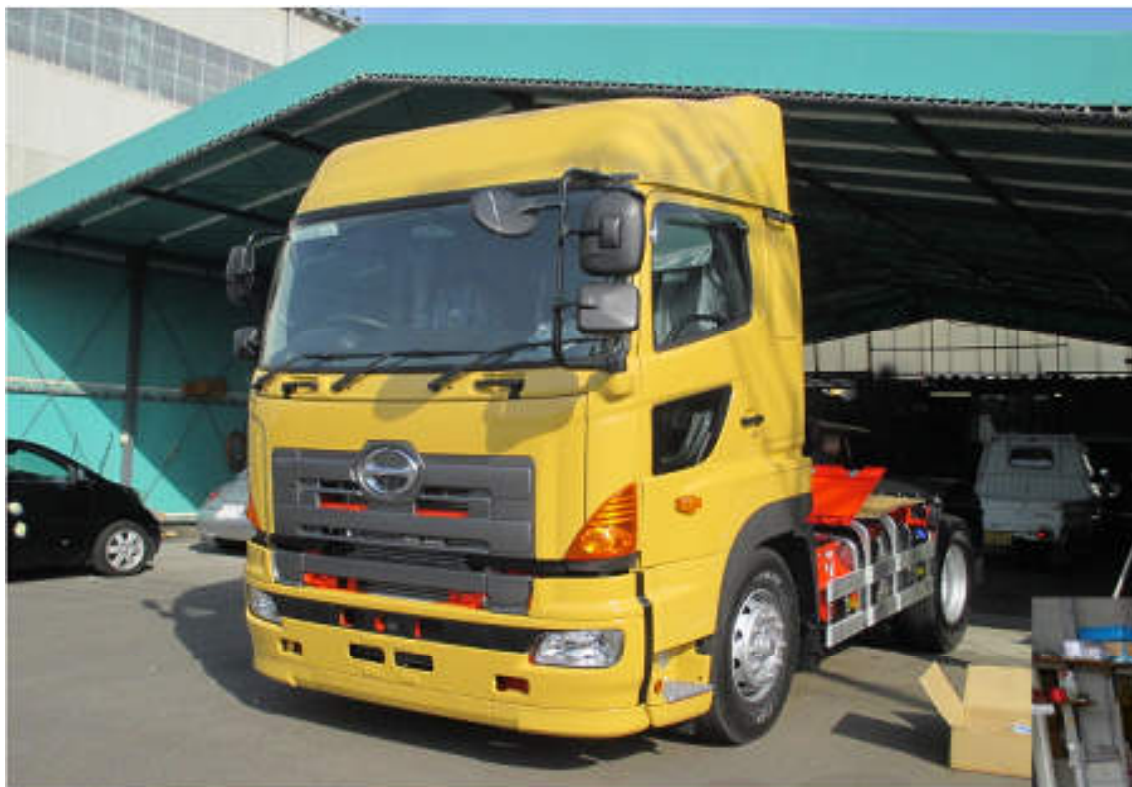
電装関係の新車架装